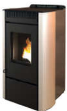
Nero - Black - Schwarz Noir - Negro