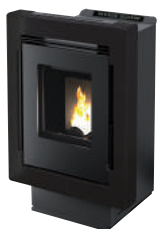
Nero opaco - Matt black -