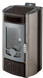
Nero - Black - Schwarz Noir - Negro