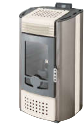
Bianco - White - Weiß Blanc - Blanco