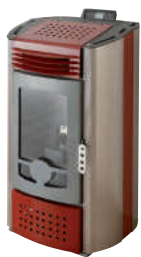
Bordeaux - Burgundy Bordeaux - Bordeaux - Burdeos