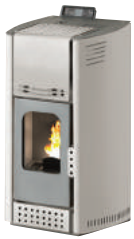
Bianco - White - Weiß Blanc - Blanco