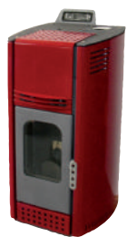
Bordeaux - Burgundy Bordeaux - Bordeaux - Burdeos