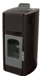
Nero - Black - Schwarz Noir - Negro