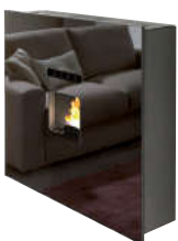
Nero - Black - Schwarz Noir - Negro