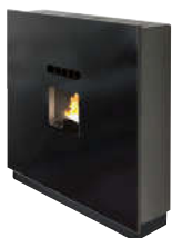
Nero - Black - Schwarz Noir - Negro