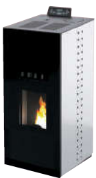
Bianco - White - Weiß Blanc - Blanco