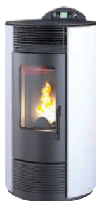
Bianco - White - Weiß Blanc - Blanco