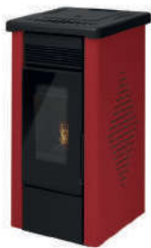
Bordeaux - Burgundy Bordeaux - Bordeaux - Burdeos