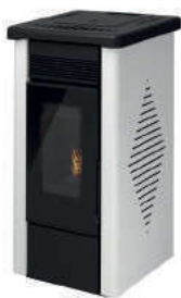
Bianco - White - Weiß Blanc - Blanco