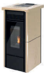
Crema - Cream - Creme Crème - Crema