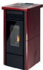
Bordeaux - Burgundy Bordeaux - Bordeaux - Burdeos