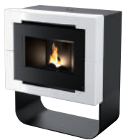
Bianco - White - Weiß Blanc - Blanco