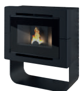
Nero opaco - Matt black