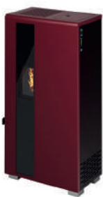
Bordeaux - Burgundy Bordeaux - Bordeaux - Burdeos