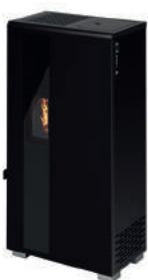
Nero - Black - Schwarz Noir - Negro