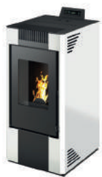
Bianco - White - Weiß Blanc - Blanco