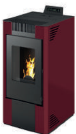
Bordeaux - Burgundy Bordeaux - Bordeaux - Burdeos