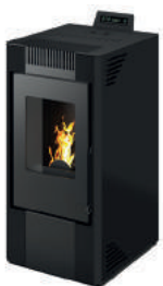
Nero - Black - Schwarz Noir - Negro