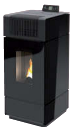
Nero - Black - Schwarz Noir - Negro