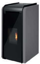
Antracite - Anthracite -