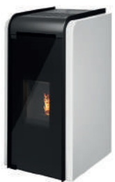
Bianco - White - Weiß Blanc - Blanco